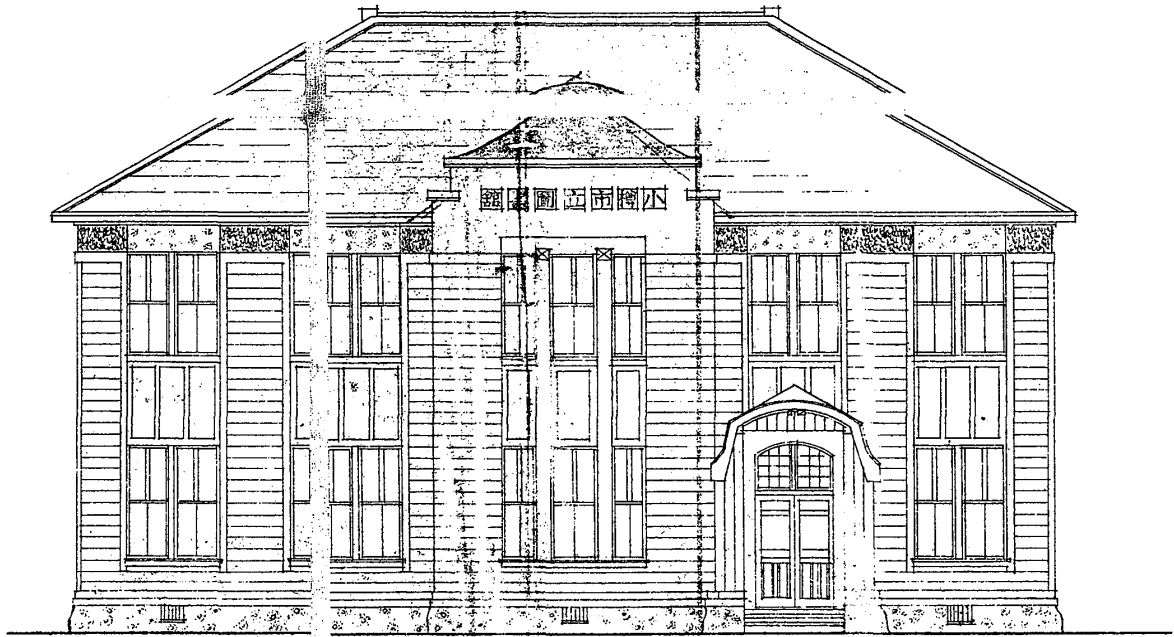
市立小樽図書館新築工事設計図 (正面図)

物には宿直室や小使室、便所がある。2階は館長室と大閲覧室があり、大閲覧室には演台が設けられ講演会などにも使用できるようになっていた。書庫はコンクリート2階建築で延べ坪数30坪。総建坪188.51坪であった。