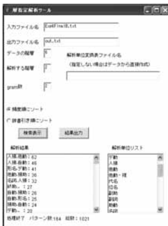
図1 層指定解析ツールのGUI

層指定解析ツールのGUI (Graphical User Interface) は次のような構成である。