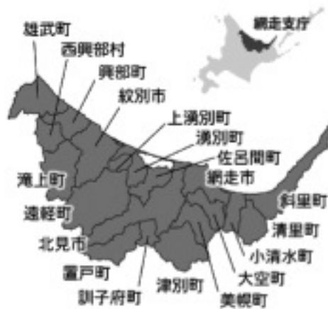
図-1 西興部村の位置

村の人口は「国勢調査」の2005年調査結果によれば1,224人である。人口の推移は1960年までは4千人を超えていたが、それ以降、減少を続け、1995～2000年にかけて増加に転じたが、2005年に再び減少している(表-1参照)。人口の年齢構成をみると、老年人口割合(全人口に占める65歳以上人口の割合)は2005年で31.3%、年少人口割合(全人口に占める15歳未満人口の割合)は10.6%であり、全国の町村平均である13.9%と24.0%とくらべて少子高齢化が進