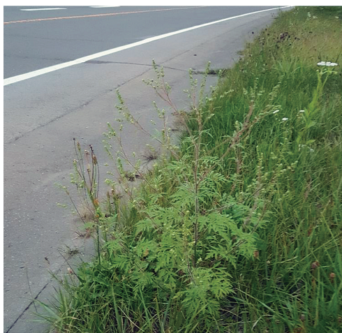
図1 道路脇に生育するブタクサ 中央に生えている植物がブタクサである。このように畑周辺や道路脇に生育している様子がよく観察された。

本研究では，2017年度，2019年度，2021年度の3つの期間にわたり，北海道内45地点より計212個体のブタクサを採取した（表1）。そのうちの31地点計117個体について，アトラジン耐性変異の検出を行った。