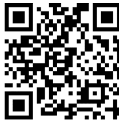
図6 マップギャラリーに出展した作品のQRコード ( https://arcg.is/1WOfL50 )