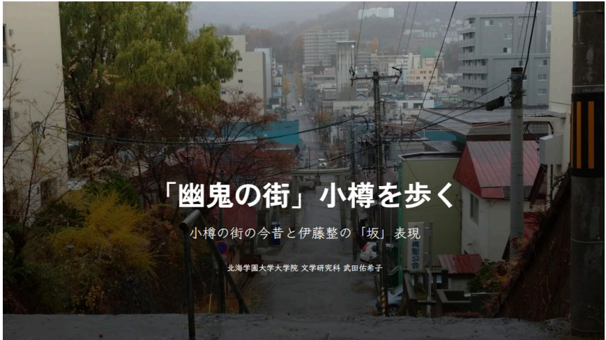
図5 「第20回GISコミュニティフォーラム」マップギャラリーに出展した作品の表紙