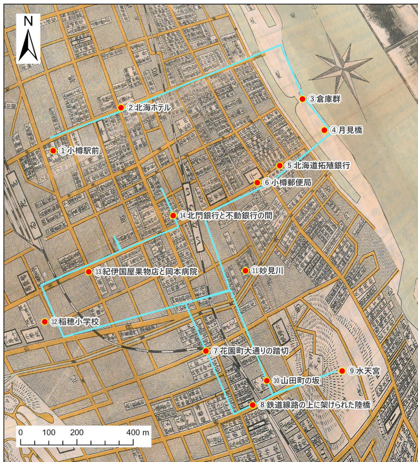
図2 「幽鬼の街」主人公の彷徨ルート 基図は大正一四年発行の「大日本職業別明細図」