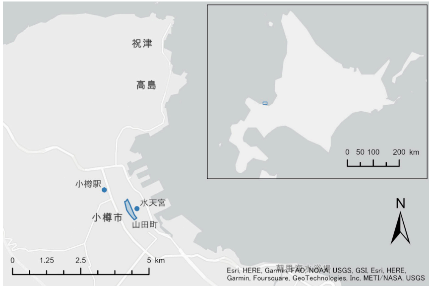
図1 小樽市地域概観図

われたことで、石炭積み出し施設の整備や船舶の大型化が進み、明治三〇年代には国際貿易港に指定される ⑬ ほど急速に発展していった。