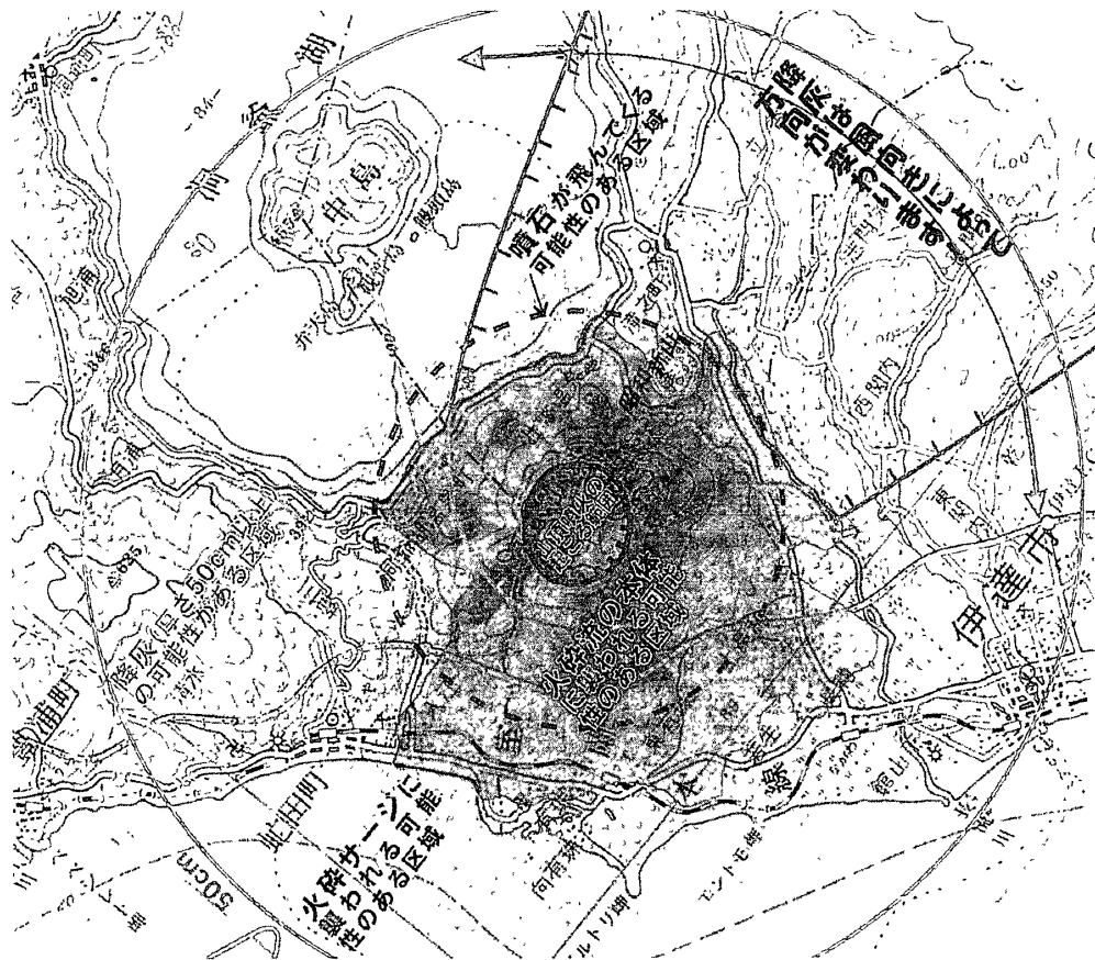
図3 新しい防災マップによる山頂噴火の危険区域予測図

資料：北海道防災会議地震火山対策部会火山対策専門委員会監修「有珠山火山防災マップ—新たなる備えのために（平成14年2月）」