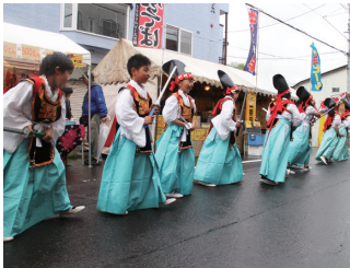
写真7 小樽市の四ヶ散米行列 (2017年)