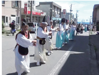
写真6 奥尻町の四ヶ散米行列 (2019年)