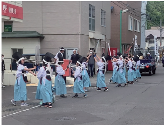
写真5 礼文町の四ヶ散米行列 (2021年)