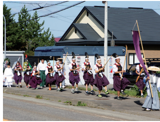
写真2 知内町の四ヶ散米行列 (2015年)