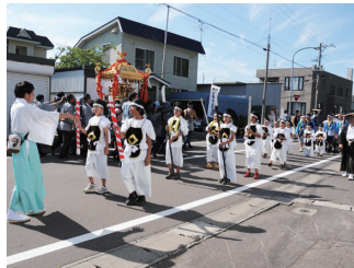
写真8 黒松内町の四ヶ散米行列 (2010年頃)