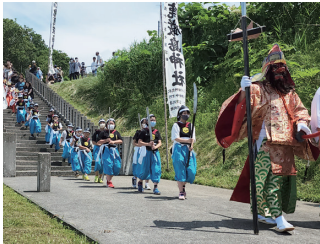
写真3 小平町の四ヶ散米行列 (2022年)