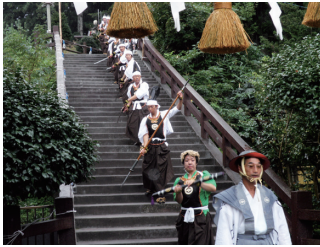
写真1 福島町の四ヶ散米行列 (2010年)