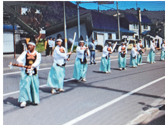
写真4 利尻町の四ヶ散米行列 (2019年)