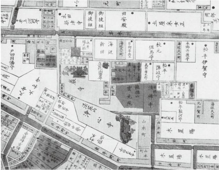
安政五年尾張屋版『江戸切絵図』-深川寺町界限

御役不足申居候者共有之哉之事 ⑧ 。第四項は松平忠固とともに一橋派有司の排除に手をつけ、玉突きで「轉役」が広がる中にその影響を確かめようとするものであったが、これとは別に、後述するように第一項から第三項までが一綴り、内、第一項は次項の前提となる案件で、第二項と第三項が別途追加の手配り(その意味は後述する)を見すえた調査項目であり、以上からするとまるで深川の寺町界限が順繰りの標的とされたかのようである。一橋派への対抗を目指して大老に就任した井伊は、実のところ、その権力の掌握を当該方面から、すなわち將軍の信任を競うライバルの排斥とこれを介した老中席過半の確保から始めていた。