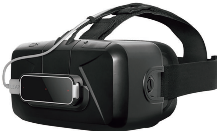
図4 Oculus DK2の正面に Leapmotion をマウントした状態 3)

ターフェースを取ることを目的としている。このため Oculus の開発環境と合わせて開発環境を構築し、また動作においても互いに影響を与えないように開発を行う必要がある。