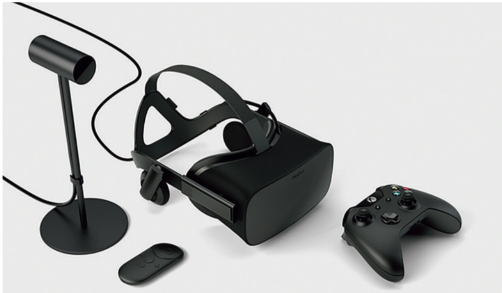
図1 Oculus Rift 初期出荷内容，中央部が Rift 本体，左端が Sensor，その手前 Oculus Remote（リモコン），及び右端が Controller（X-BOX ゲームパッド） 1)

レイでは，VR酔いと呼ばれる乗り物酔いに似た症状を感じることもある。これは，首振りの動作と得られる視界の間で時間的な隔りがある場合に起こりやすい。Oculusでは，装着者の首振りに対する画面描画の反応時間が20 msecとされている。一般的なスマートフォンやタブレットなどでは100 msec程度なので非常に高速な対応がなされている。またVR酔いを避けるためにレンドリングされた各フレームを補正して首振り運動と違和感が生じにくいための工夫がなされている。このような対策を行うためにレンドリングを行う画像領域は実際のディスプレイサイズよりもはるかに大きな領域を取っていると考えられ，また画像のリフレッシュレートも一般のディスプレイの30 Hzに対してOculusでは90 Hzと高いレートを維持している。