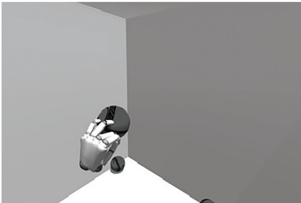
図6 発生させた球オブジェクトを把持している状況

認識が発生し、存在しないはずの手がシーンに表示される。原因としては Leapmotion をモニタ画面に向けてしまうことで、赤外 LED 発光がモニタ画面で反射されてしまい誤認識が発生していると考えられる。