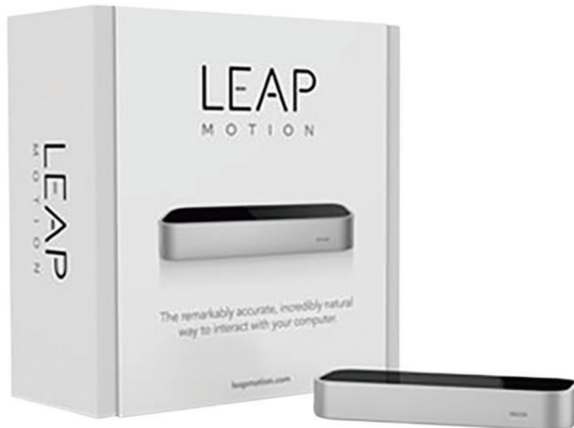
図3 Leapmotion controller 装置外観図 3)