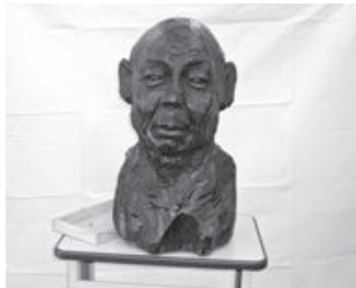
写真1 柴崎重行作「父の像」