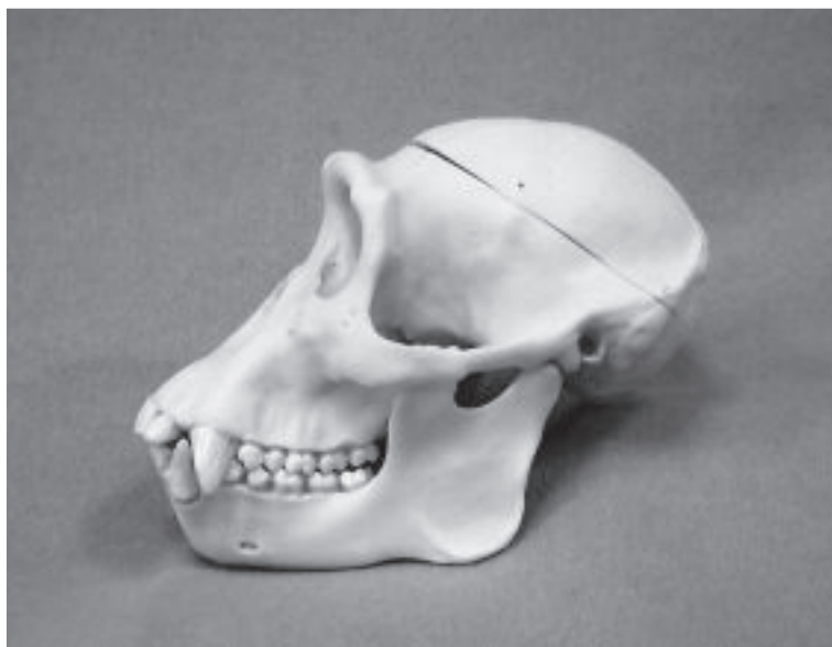
図2 チンパンジーの頭蓋骨