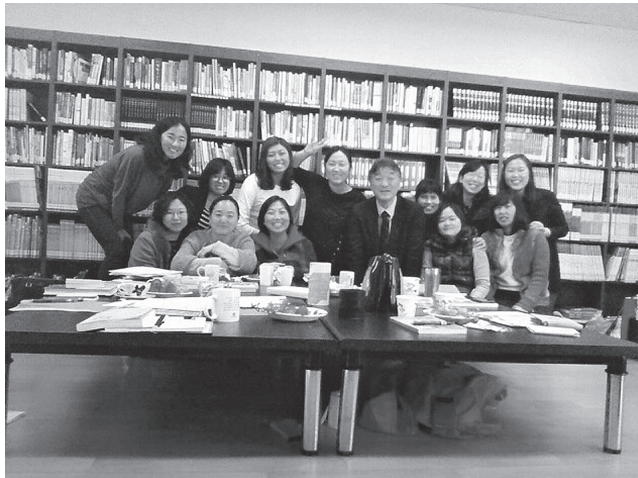
団地図書室でのメンバーとの記念写真