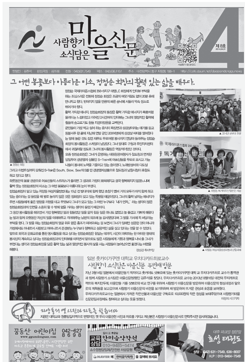
「人の香りの消息を盛り込んだマウル新聞」2014 年 4 月号表紙。筆者の訪問が記事になっている。