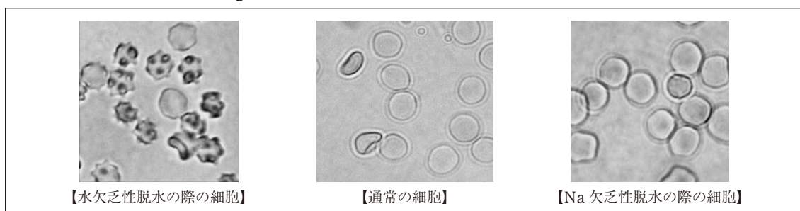
Figure 7 新たにテキストに追加した細胞の変化の図示

更に、症状判断課題の問題毎の事前から事後へ、事前から遅延Ⅰへの正答率の差を、CR値を求め検定したところ（Table 11）、「喉の渇き記載」項目群では、問題⑧⑨⑩の3項目について、事前一事後、事前一遅延Ⅰにおいて有意な上昇が見られた。一方、「喉の渇き記載なし」項目群については、全ての問題の事前一事後、更に、全ての問題の事前一遅延Ⅰにおいて有意な上昇が見られた。この結果より、実験Ⅰ同様、学習者は予め認識して