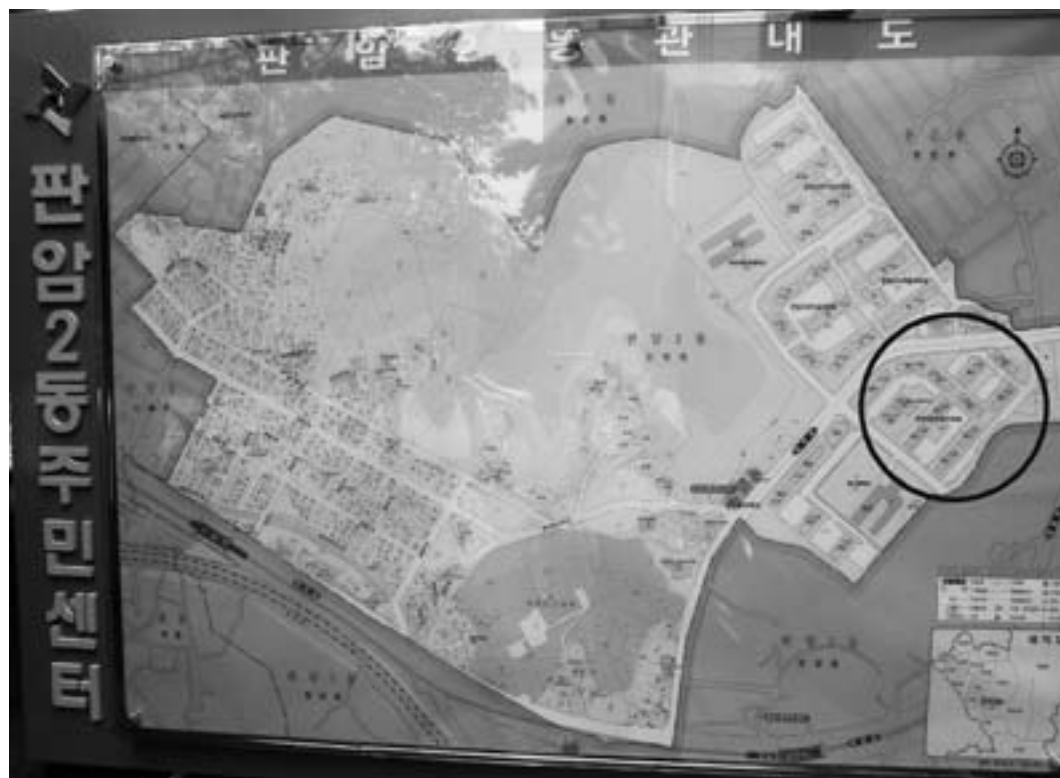
図2 パナム2洞の全体図と「パナム住公4団地」の位置

「パナム住公4団地」での「虹プロジェクト」は、生命総合社会福祉館のI館長をはじめ同館の中堅幹部職員による地域住民への積極的な働きかけと支援、そして地域のネットワークャーとしての働きによって推進したと高く評価されている 15) 。特に幹部職員は虹プロジェクト諮問委員会の委員の1人として、大田広域市の「虹プロジェクト」担当職員と「パナム住公4団地」を取り結び、パナム2洞住民センター職員と住民自治委員会のメンバーと「パナム住公4団地」を繋ぎ、周辺住民と「パナム住公4団地」住民との相互理解を深める等、「連結の輪」の役割を果たしたという。また、タウン誌「パナムゴルの便