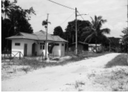
写真6 スンガイサヤップ村

ンアスリ局の勧めに従い、農耕を開始し、1976年にはゴム産業小農開発公社（RISDA：Rubber Industry Smallholders Development Authority，以下 RISDA）の管理のもと現金収入源としてゴムを植林した（写真7）。現在は、8.4 ha のゴム園を有している。また、1991年には、FELCRA の管理のもとでアブラヤシ農園の開発を開始した。1992年には87 ha の面積にアブラヤシを植え、1995年から収穫が始まった。集落の北東約5 km のク