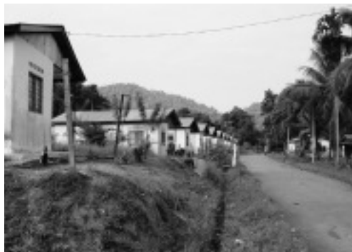
写真1 スンガイブロア村

教局の役人がそれぞれ常駐し、日常生活や宗教活動に関してオランアスリに助言を行っている。このうち宗教局の役人とその妻は、住宅で食料品や生活必需品を販売する商店を経営している。