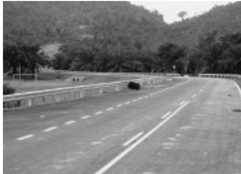
写真5 村からクンニャー湖へ続く道

前述のように、スンガイプロア村の周囲には広大なアブラヤシ農園が広がっているが、村人がアブラヤシ農園の作業に従事して現金を得ることはほとんどない。オランアスリ局及び FELCRA によるアブラヤシ農園の開発は、オランアスリをアブラヤシ農園での作業に従事させ、安定的な現金収入をもたらすことを目的としていたが、村人は開発へのコミットメントにはあまり積極的ではなく、籐や香木といった森林産物の採集やインドシナオオスッポン漁によって現金を得ることに多くの時間を費やしている。これは、スンガイプルガム村（Ramle, 1993）や次に紹介するスンガイサヤップ村とは大きく異なっている。