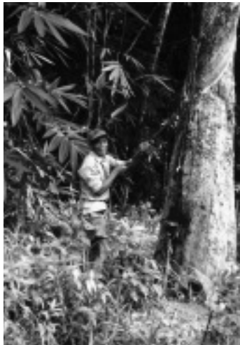
写真7 ゴム樹液採集

ンアスリ局の勧めに従い、農耕を開始し、1976年にはゴム産業小農開発公社（RISDA：Rubber Industry Smallholders Development Authority，以下 RISDA）の管理のもと現金収入源としてゴムを植林した（写真7）。現在は、8.4 ha のゴム園を有している。また、1991年には、FELCRA の管理のもとでアブラヤシ農園の開発を開始した。1992年には87 ha の面積にアブラヤシを植え、1995年から収穫が始まった。集落の北東約5 km のク