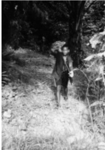
写真9 アブラヤシの実の収穫

ヤップ村に暮らしていた。その後、一人の老年男性と一人の若年女性が亡くなり、三人の男子が生まれている。