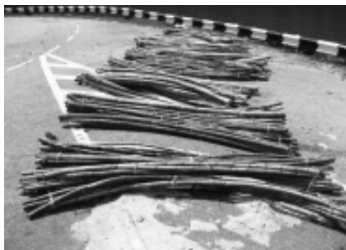
写真3 道路に集められた籐