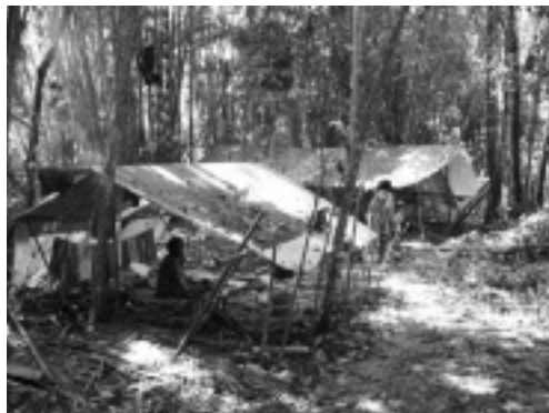
写真 10 森の中で暮らすグループ（クランタン州クアラコー周辺）

らの一部は、主として狩猟・採集・漁労によって食料を入手し、森林産物の交易で現金収入を得ている。つまり、スンガイサヤップ村に残ったのは、開発プロジェクトや定住を素直に受け入れた人々なのである。