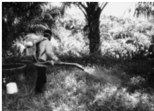
写真 8 アブラヤシへの農薬散布

2002 年の調査時には 6 世帯 26 人(男性 10 人、女性 16 人)がスンガイサ