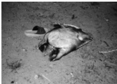
写真4 捕獲されたインドシナオオスッポン

るようになった。さらに、2007年には、自動車でクランタン州へ出かけ、バテッ・デの集落があるクアラコー周辺やルビル川上流で漁を行うようになった。