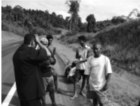
写真2 新たな道路を利用し、クンニャー湖北岸で香木採集に出かけるグループ

ンニャー湖北岸はそれまであまり利用してこなかった場所であり、2007年に採集された香木の量は2002年をはるかにしのぐ。これらの採集グループは若年及び成人男性によって構成されており、基本的生産単位が伝統的な核家族から男性のみのグループに変化したことが伺える (Kuchikura, 1987)。